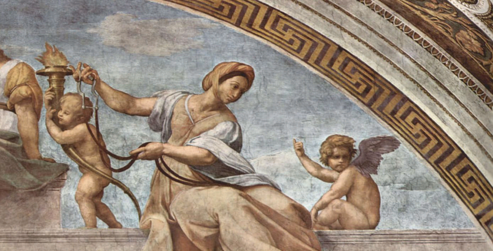
Ausschnitt aus „Die Kardinal- und Gottestugenden“ von Raffael, Fresko in den Stanzen des Raffael.

higkeit, in Einsicht, Vernunft und Entscheidung das Gute zu erkennen und auch zu tun. Nach Aristoteles ist die Tugend eine vorzügliche und nachhaltige Haltung, die durch Vernunft bestimmt wird und die man durch Einübung bzw. Erziehung erwerben muss. Zur richtigen Bestimmung der Tugenden sucht man die Mitte (mesotes) zwischen zwei lasterhaften Extremen. Die Mäßigung zum Beispiel ist die richtige Mitte zwischen Empfindungslosigkeit und Zügellosigkeit. Die Mitte ist hierbei nicht als arithmetisches Mittel zu verstehen, sondern als das Beste, das man im Bereich einer Charaktereigenschaft erreichen kann.